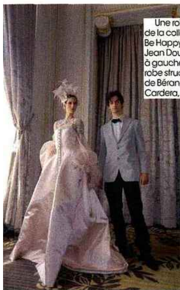
Une robe de la collection Be Happy par Jean Doucet, à gauche. Une robe structurée de Bélangère Cardera, à droite.